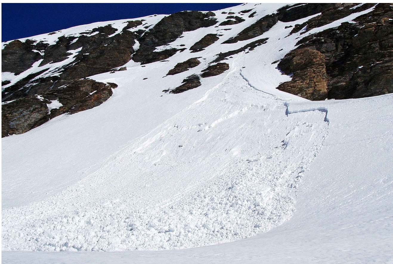
Figure 3 : avalanche de neige issu d'un seul point et impliquant la neige mouillée en fin de saison. L'épaisseur de la dalle de neige humide ne dépasse pas quelques dizaines de centimètres.

assurent ainsi une forte cohésion. Lorsque la teneur en eau liquide dépasse un seuil critique (de 3 % à 5 %), l'eau s'infiltré dans les couches inférieures et peut se concentrer le long du sol ou de croûtes de regel au sein du manteau neigeux. Si la température de l'air est trop élevée et la neige ne gèle plus la nuit, la neige perd sa cohésion. La plupart du temps, les avalanches partent d'un point et gagnent en volume au fur et à mesure qu'elles descendent. Ces avalanches sont appelées avalanches de neige mouillée. La figure 3 montre de tels départs ponctuels.