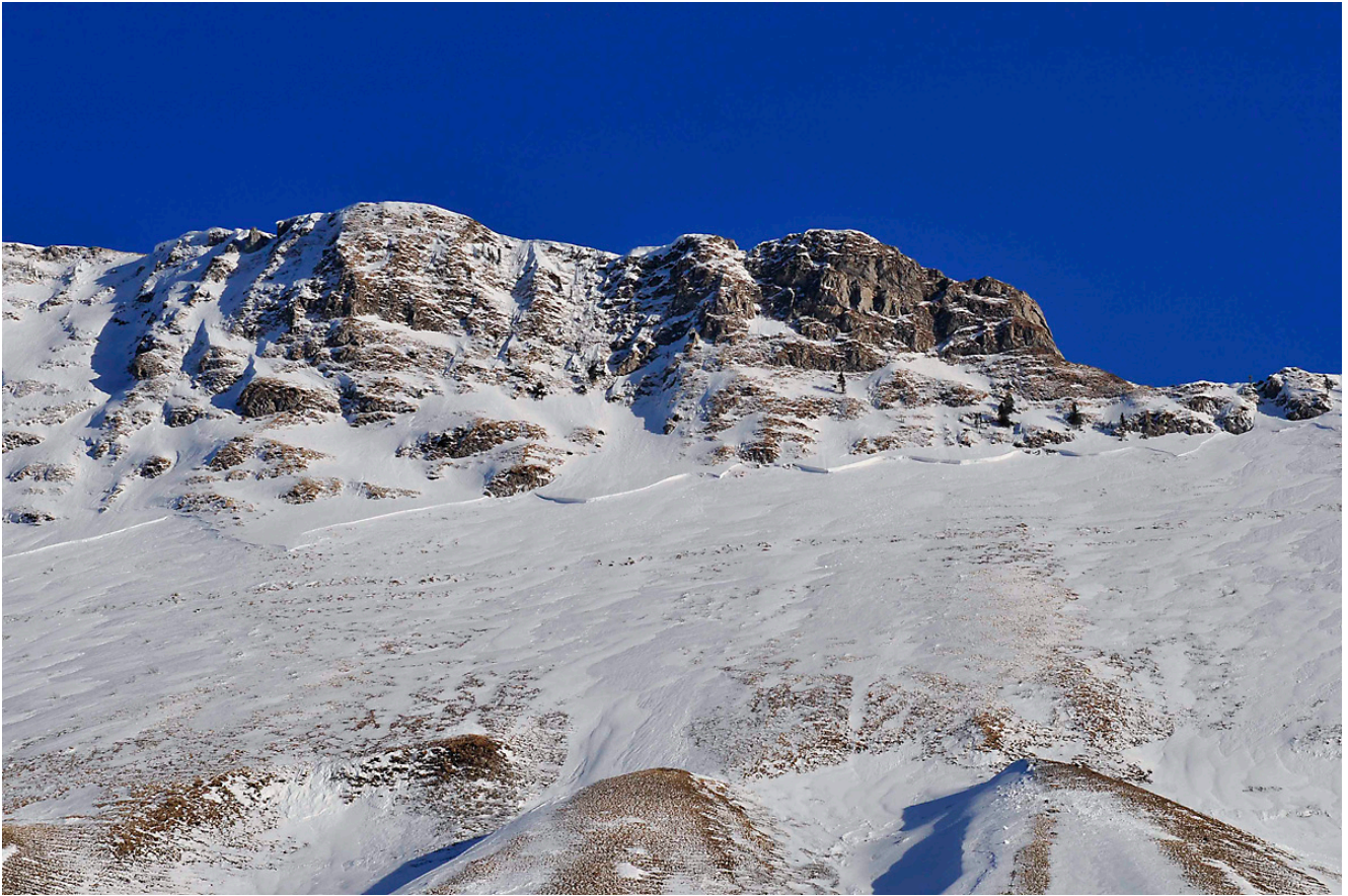
Figure 2 : déclenchement d'une plaque sur tout le versant ouest de la Dent de Lys (Canton de Fribourg, Suisse).

Lorsque l'on approche de la fin de la saison, la structure du manteau neigeux évolue radicalement sous l'effet de l'eau liquide. En raison de la température de l'air ou des pluies, une partie des grains de neige fond. L'eau liquide a des effets différents sur la neige. En premier lieu, elle modifie les liaisons entre les grains de glace et, en particulier, elle favorise la formation de grains de glace maintenus ensemble par des forces capillaires provenant des ménisques d'eau formées au niveau des points de contact entre ces grains. Par ailleurs, lorsque la teneur en eau liquide est suffisamment élevée (supérieure à 3 %), la couche liquide recouvrant la surface des grains peut s'écouler lentement sous l'effet de la gravité vers les couches à la base du manteau neigeux, ce qui altère la structure entière du manteau neigeux. Une faible teneur en eau liquide consolide généralement une couverture neigeuse : les couches fragiles sont progressivement transformées et lors du gel nocturne, les ponts liquides entre les grains de neige gèlent de nouveau et