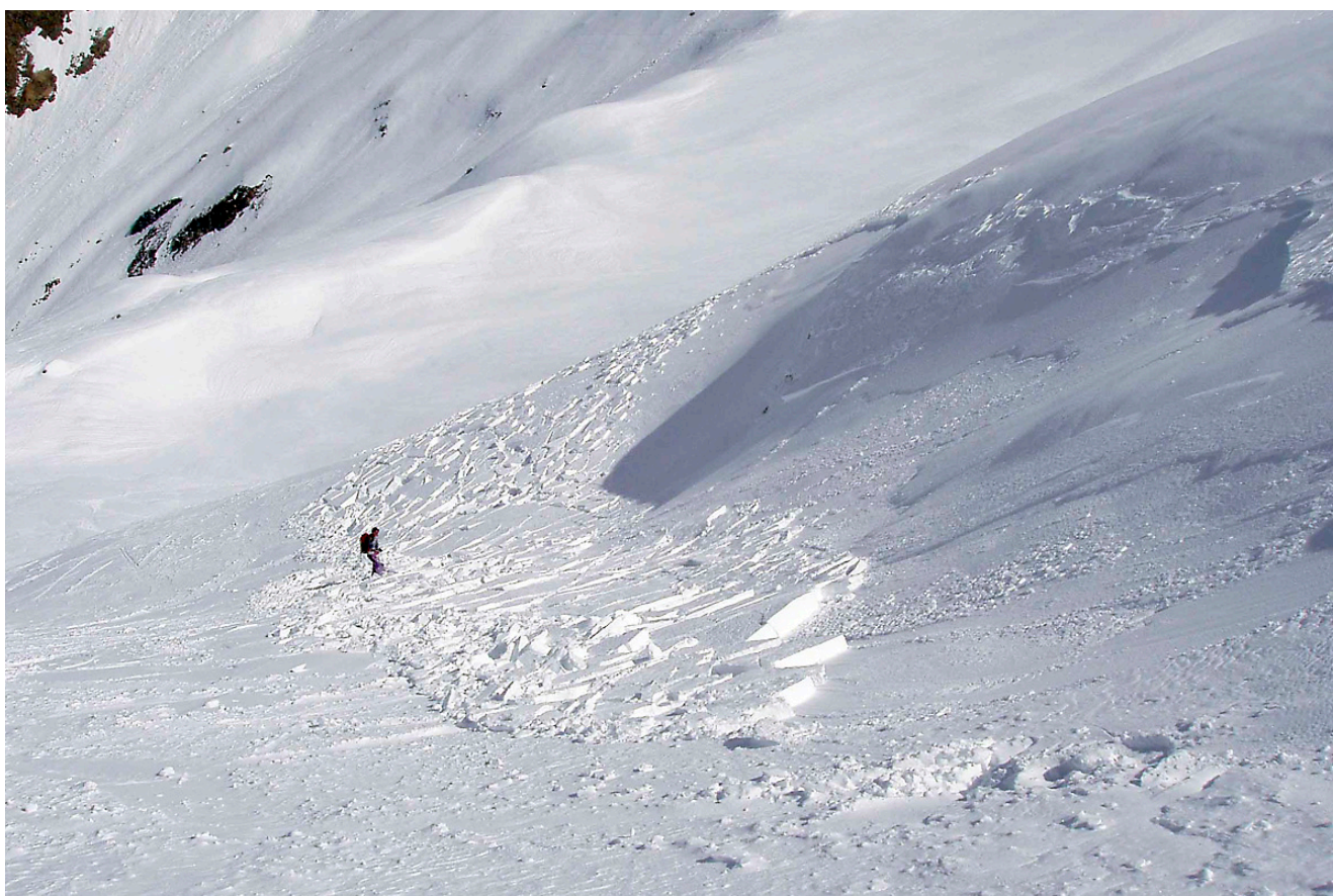
Figure 2 : déclenchement d'une plaque au passage d'un skieur (col de l'Eglise, massif Belledonne, Isère, France).

Est-il réellement saugrenu de penser qu'une onde sonore puisse déclencher une avalanche ? Car, après tout, ce sont bien des explosifs qu'on emploie en station pour sécuriser les pistes de ski en déclenchant préventivement les avalanches. Et il existe par ailleurs de nombreux récits de randonneurs emportés par une avalanche quoiqu'ils se trouvaient loin de la zone de départ (donc qu'est-ce qui pourrait expliquer l'avalanche hormis un malheureux concours de circonstances ?).