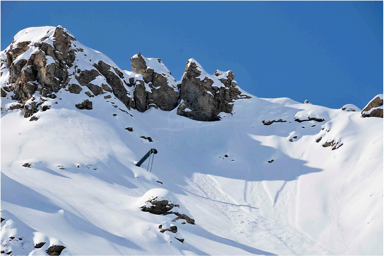
Figure 3 : tube Gazex émergeant du manteau neigeux. La détonation du mélange propane-oxygène est réalisée dans une chambre sous terre, puis se propage dans le tube, qui dirige l'onde de choc vers le manteau neigeux.

Les études in situ, comme celles de Juerg Schweizer (SLF), ont montré que pour mettre en mouvement un manteau neigeux particulièrement instable, il suffit d'appliquer une surpression relativement faible de l'ordre de 200 à 500 Pa ; pour des manteaux neigeux plus stables, il faut exercer des surpressions importantes (plusieurs milliers de Pa). Un tel seuil disqualifie donc la voix comme moyen de déclenchement, mais montre qu'un avion militaire pourrait déclencher une avalanche s'il passe le mur du son au-dessus de pentes de neige instable.