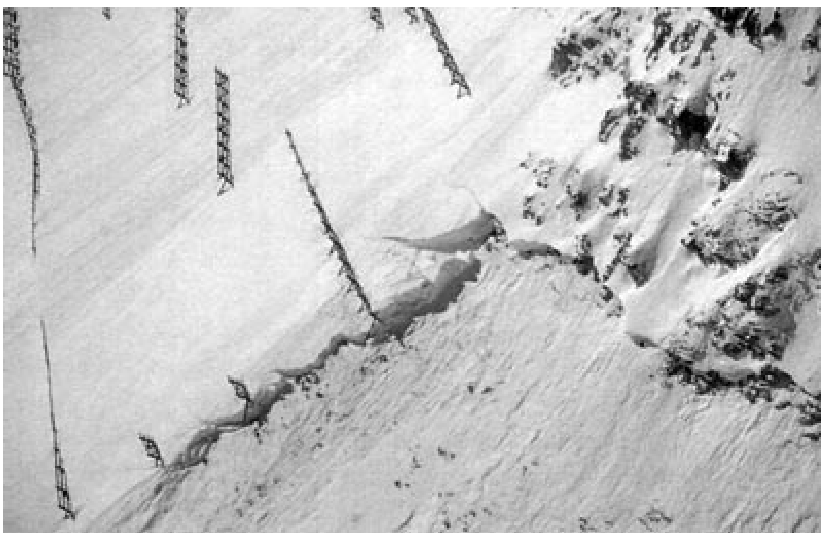
Lignes de clais abimées au-dessus de Zermatt (Valais).

Tolérance aux erreurs : la méthode de détermination du risque d'avalanche s'est révélée dans un certaine mesure comme robuste par rapport aux erreurs que l'on avait pu commettre. Quoique ponctuellement les épaisseurs de neige déclenchée étaient supérieures aux valeurs acceptées, les distances d'arrêt calculées n'ont été dépassées qu'exceptionnellement.