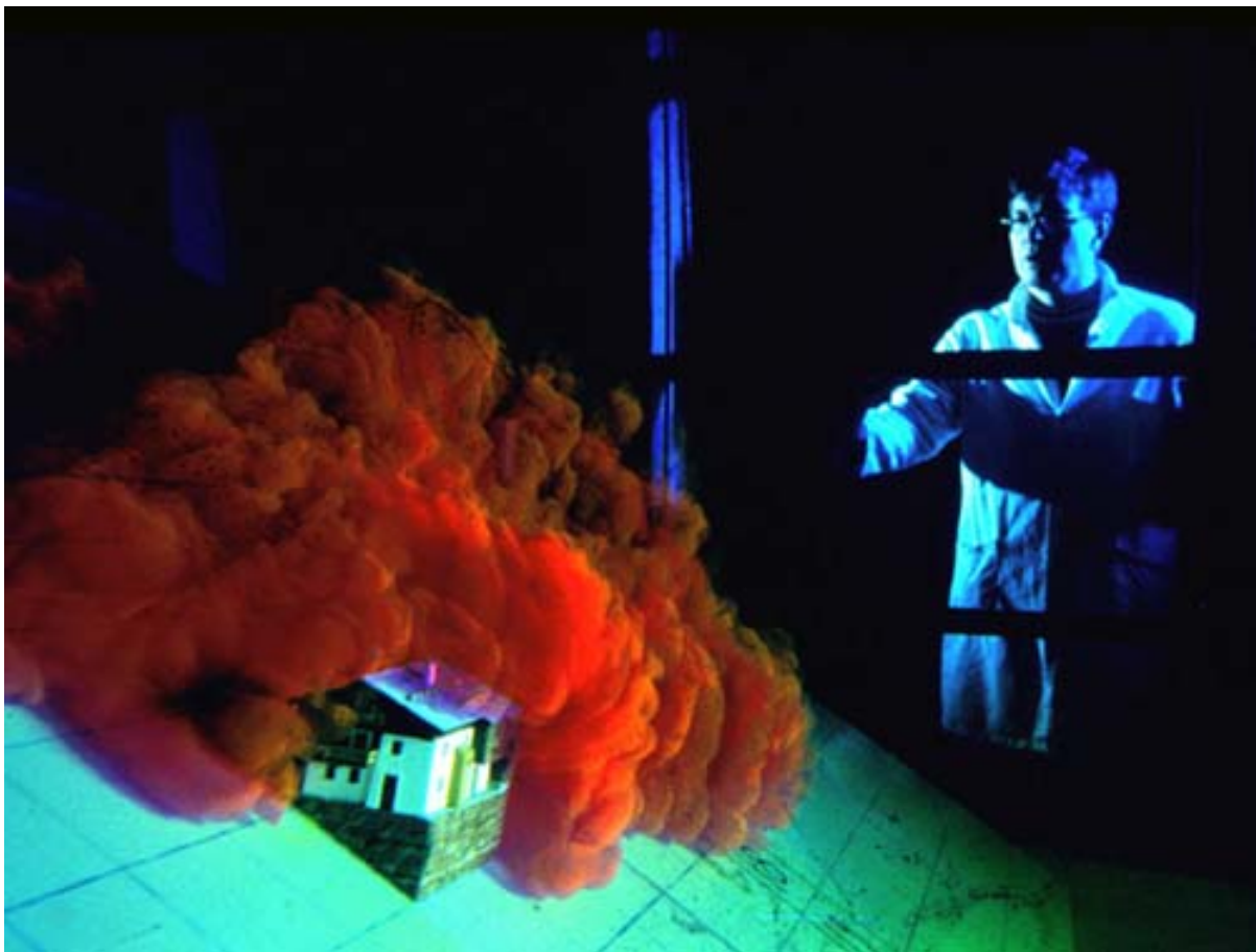
Essai en laboratoire (Cemagref) visant à reproduire une avalanche en aérosol.

dans l'étude des avalanches, où les ingénieurs civils ont progressivement remplacé les forestiers. On entre alors dans la période moderne de la lutte contre les avalanches. Une autre mutation s'amorce à la fin des années 1970 avec le développement croissant des modèles numériques. Cette mutation a été rendue possible, d'une part, par l'accroissement considérable de la puissance des ordinateurs et, d'autre part, par le développement d'équations décrivant le mouvement des avalanches. C'est sur ce dernier point que l'URSS a joué un rôle majeur et totalement méconnu, en grande partie à cause du plagiat des recherches soviétiques par des scientifiques occidentaux. On peut rendre hommage aujourd'hui à des chercheurs comme Grigorian, Eglit, ou Kulikovskiy en faisant remarquer que la plupart des modèles actuels d'avalanches prennent entièrement leurs racines dans leurs travaux.