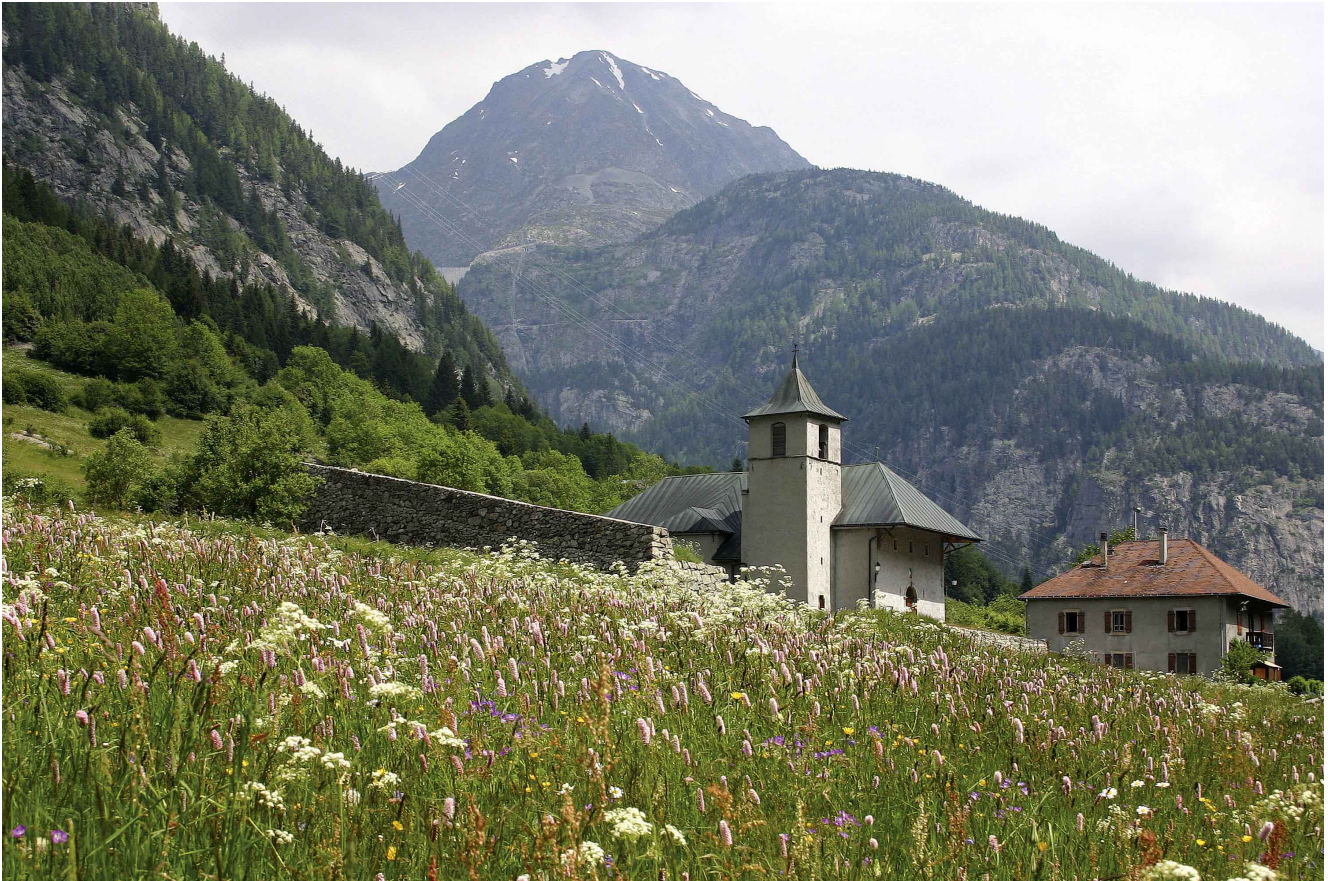
Figure 1. L'église de Vallorcine (France) et son presbytère, protégés par une « tourne » (étrave en maçonnerie), dont la construction a commencé en 1674. Elle a été renforcée et rénovée en 1720, 1843, 1861, et 2006.

croyantes comme celle de Vallorcine, Dieu épargnerait très certainement l'église. Malheureusement, cette église a été frappée à nouveau en 1720. Pour autant les habitants ne changèrent pas d'avis. Ils décidèrent tout simplement de construire une étrave en terre et pierres sèches pour protéger le mur exposé aux avalanches (voir Fig. 1).