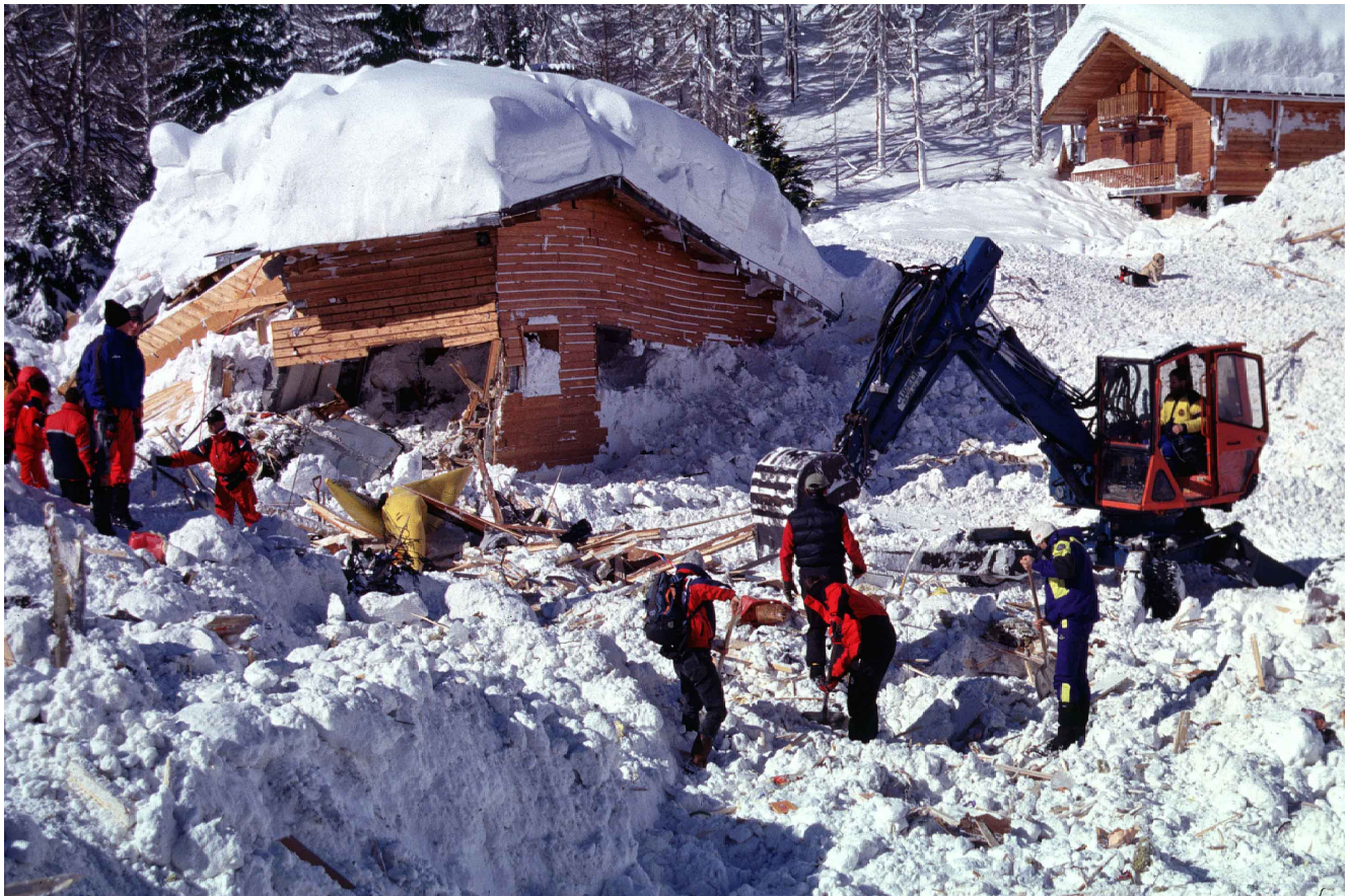
Figure 3. Les opérations de secours dans le hameau de Montroc (Chamonix, France) après qu'une avalanche a détruit vingt chalets et tué 12 occupants le 9 février 1999.