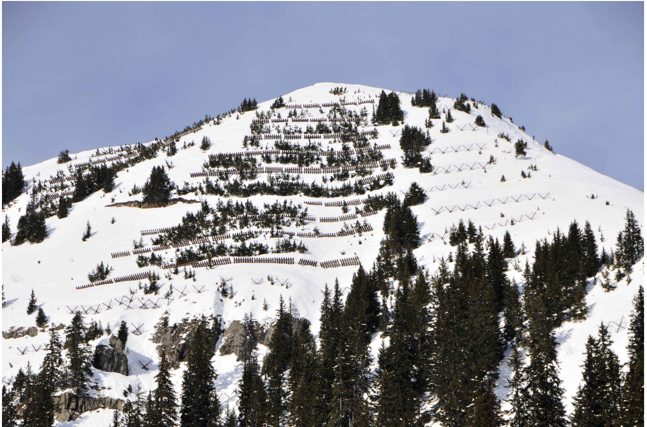
Figure 2. Mélanges de techniques de protection active dans la station de ski de Flaine (Haute-Savoie, France): partout où la couverture forestière n'est pas suffisante à empêcher la formation d'avalanche, des râteliers (au milieu) et des croisillons métalliques appelés Vela (à droite) ont été placés dans les espaces entre les arbres.

En février 1999, les Alpes ont été frappées par une série de tempêtes de neige, qui ont provoqué des avalanches catastrophiques en France (12 personnes tuées à Chamonix), Suisse (17 personnes tuées), Autriche (37 personnes tuées), et Italie (1 décès). La figure 3 montre les opérations de secours à Montroc (commune de Chamonix-Mont-Blanc) juste après qu'une avalanche a balayé vingt chalets. La perte économique en raison de dommages aux équipements et habitations ainsi que les coûts indirects liés à la diminution des recettes touristiques ont été très importants. Si les systèmes de protection n'ont pas pu fournir une sécurité totale en février 1999, ils ont évité l'occurrence de catastrophes plus grandes alors que la saison touristique battait son plein. Juste pour la Suisse, les paravalanches ont empêché le départ ou limité la propagation de plus de 300 avalanches affectant des