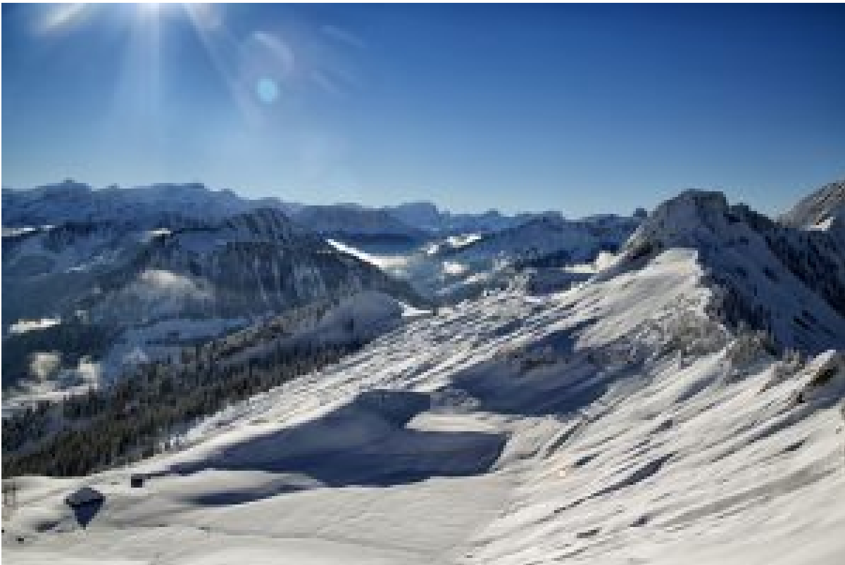
Figure 1 : le Pays d'en Haut vu depuis le col du Lys (FR) le 12 novembre 2016.

L'hiver 2016-2017 commence précocement avec de belles chutes de neige jusqu'à basse altitude. Heureuse surprise pour moi qui monte depuis les Paccots au col du Lys le samedi 12 novembre 2016. Bonne neige et épaisseur suffisante. Mais une chute précoce n'est jamais bon signe pour la suite.