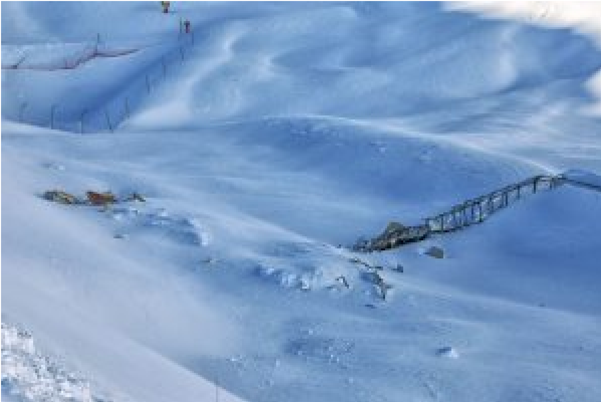
Figure 5 : tapis du Grand Yéti endommagé après l'avalanche du 16 janvier 2017.

L'analyse des chutes de neige montre que (i) les trois plus gros cumuls se sont produits à une date récente (2013 et 2016) ; (ii) on compte 17 événements ayant amené plus de 150 cm de neige depuis 183 (en moyenne un tous les deux ans), mais parmi ceux-ci 8 se sont produits au cours des 5 dernières saisons. Il y a donc eu un accroissement très sensible (d'un facteur 7) de la fréquence d'occurrence des gros épisodes de neige puis que sur la période 1983-2012, on compte 8 événements en 30 ans, soit une probabilité annuelle de 0,26 alors que pour les 5 dernières années, on en compte 9, soit une probabilité annuelle de 1,8.