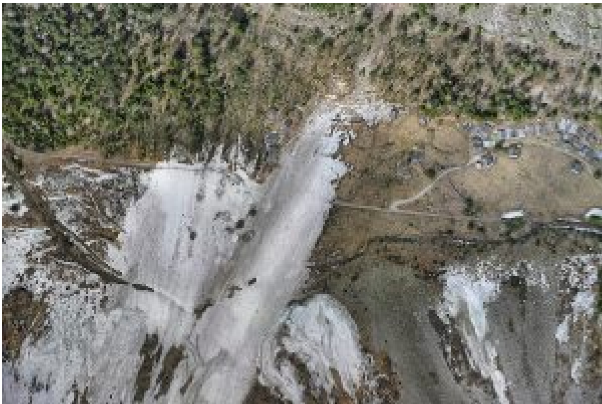
Figure 8 : avalanche du mercredi 8 mars 2017 au Van d'en Haut, commune de Salvan (VS).

Le hameau (non habité durant l'hiver) du Van d'en Haut sur le territoire de la commune de Salvan (VS) a été touché sévèrement par une avalanche issue de la pointe de la Djoua le mercredi 8 mars 2017 [7]. Dans le val Ferret et la vallée de la Dranse, il y a eu une activité avalancheuse de grande ampleur comme le montrent les dommages à la forêt à Champex ou au chalet d'alpage dans le val Ferret.