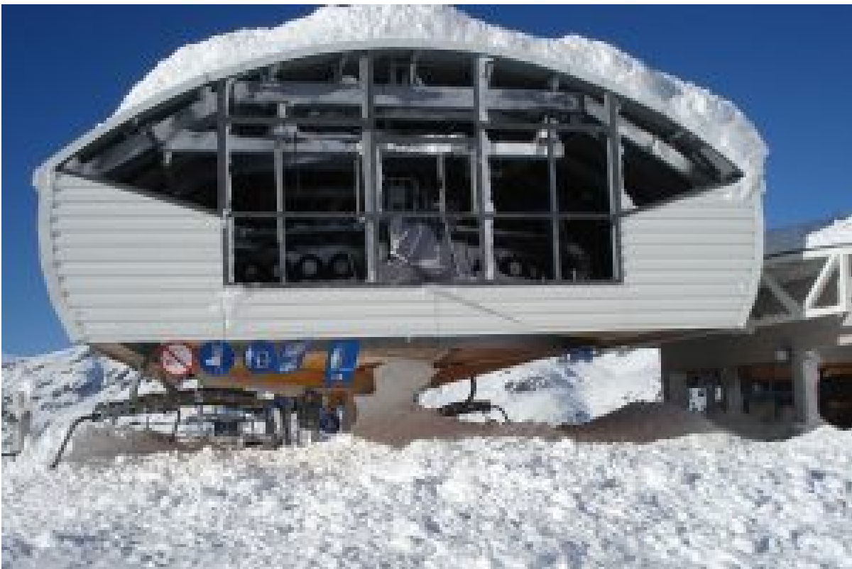
Figure 4 : dommage à la gare (endommagement des surfaces en plexiglas du tympan).