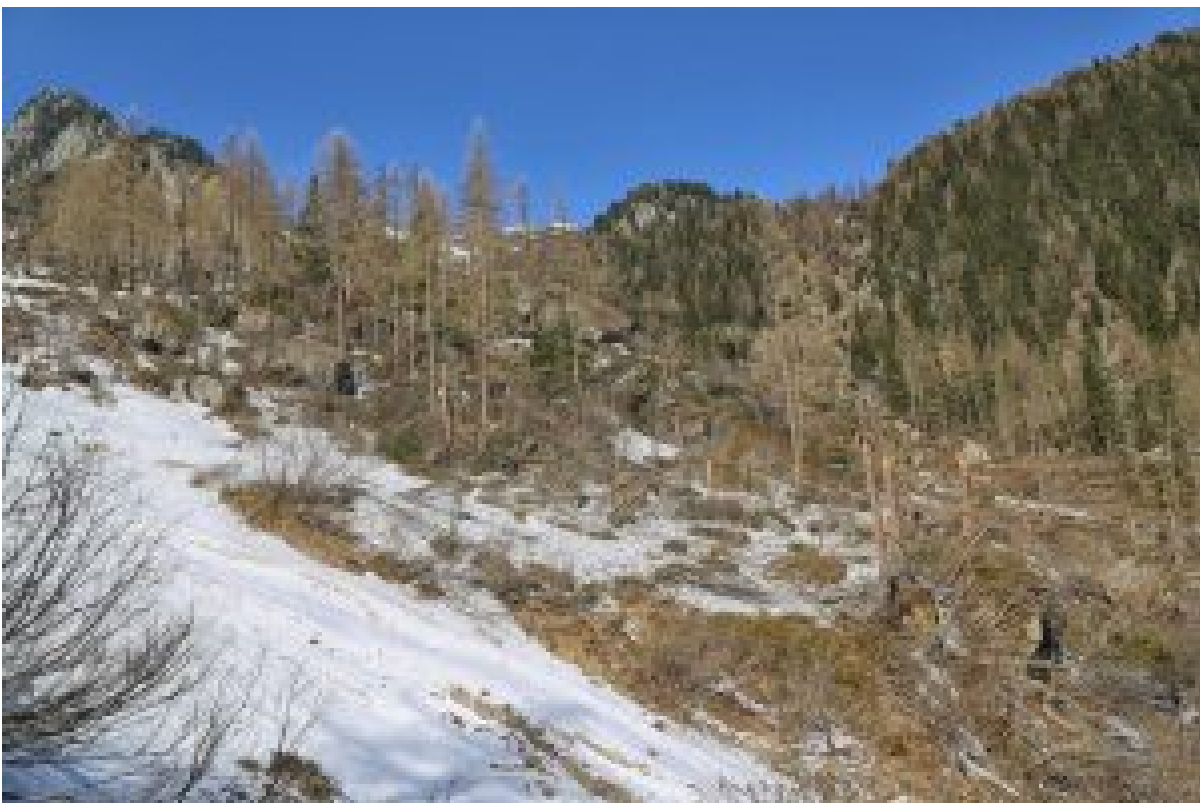
Figure 10 : combe du Barmay sous les clochers d'Arpette (commune de Champex, VS) en avril 2017.