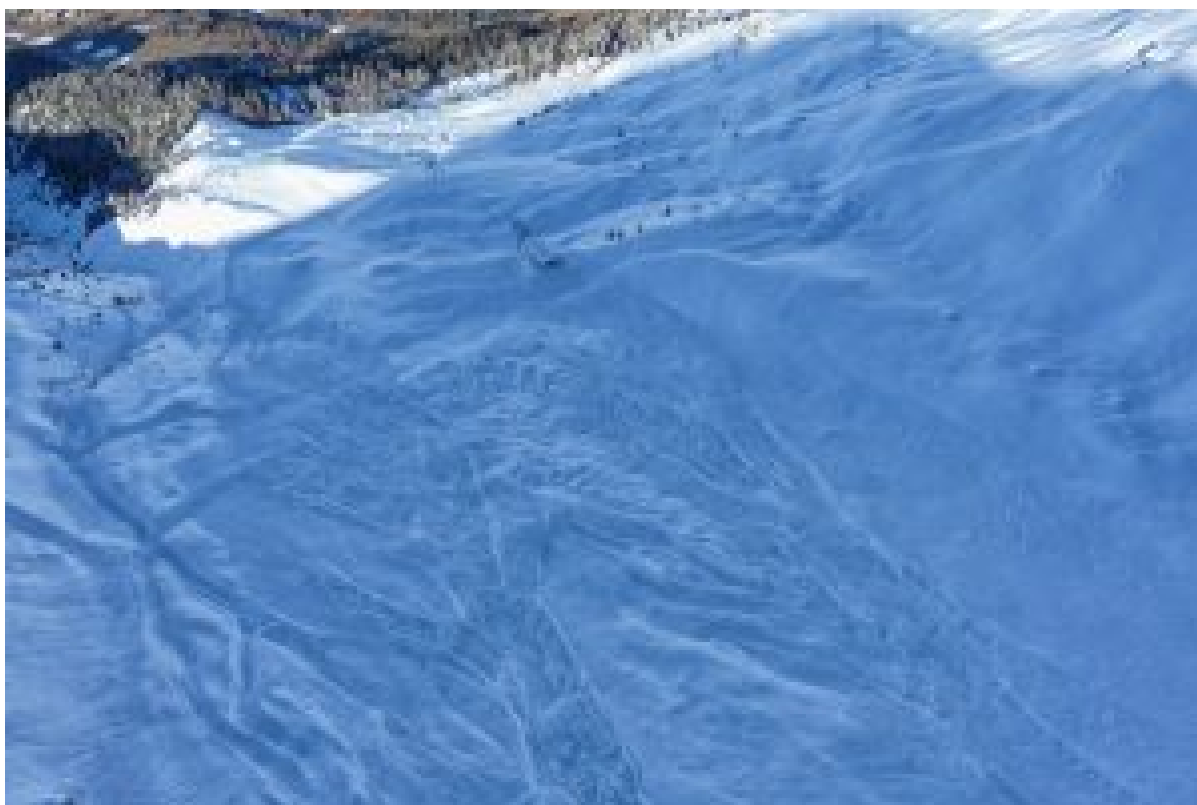
Figure 2 : le cirque de l'Arcelle vu depuis hélicoptère après l'avalanche du 25 novembre 2016.

du Simplon en Suisse. Pour le Simplon, le cumul de neige sur 6 jours se situe entre 1 et 2 m à 2400 m [1]. Selon Météo-Suisse [2], l'épisode de flux de sud du 20 au 25 novembre 2016 est le troisième épisode le plus long depuis 1981. Il est notamment plus long que celui de novembre 1996, qui avait également occasionné de fortes chutes de neige le long de la frontière italienne et dans les Alpes du Sud (avalanche causant des dommages à Orcières Merlette). En revanche, si les quantités de neige ont été très importantes, elles n'ont pas été exceptionnelles pour les Alpes Suisses puisque aucun cumul supérieur à 250 cm n'a été observé.