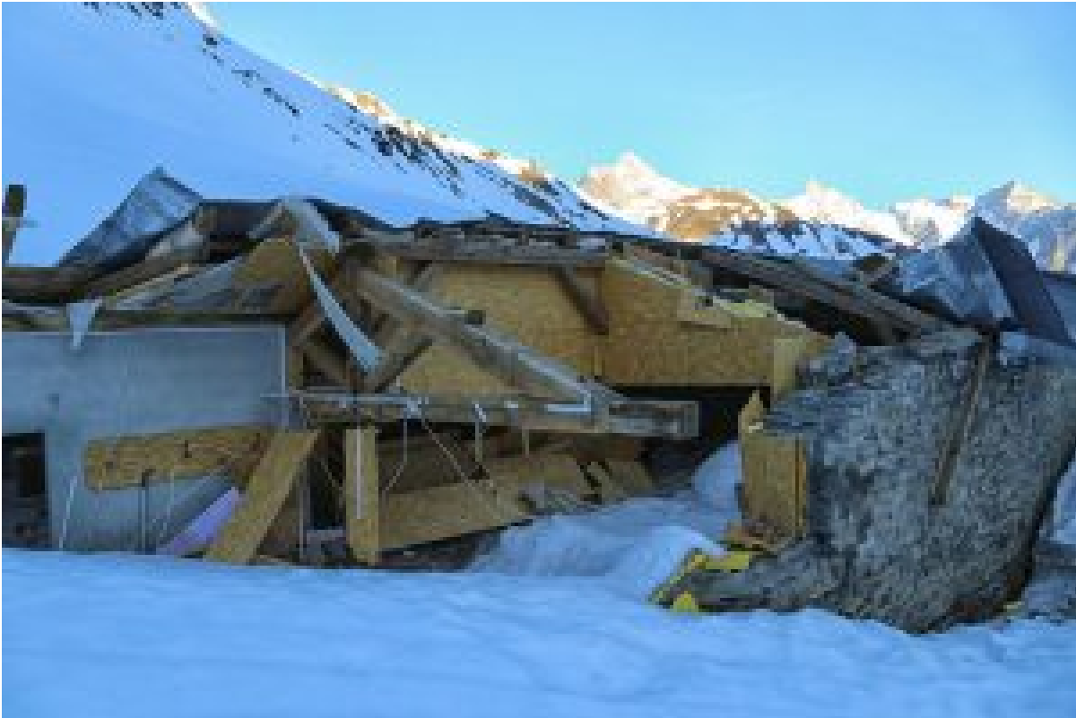
Figure 9 : alpage du mont Percé (2023 m) dans le Val Ferret (commune d'Orsières, VS) endommagé par une avalanche venue du mont Fourchon à une date inconnue, sans doute le 8 mars 2017. Cliché pris en avril 2017.