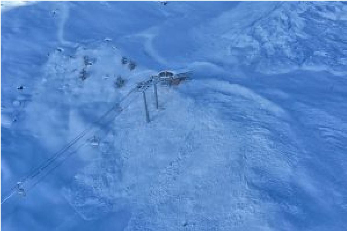
Figure 3 : gare d'arrivée du TSD l'Arcelle vue depuis hélicoptère après l'avalanche du 25 novembre 2016.